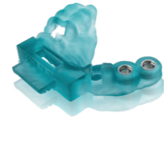
VarseoWax Surgical Guide