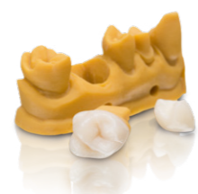
Varseo Smile Crown plus