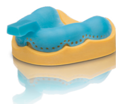
Varseo Wax Tray