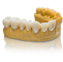
Varseo Smile Temp