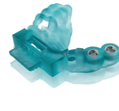
Varseo Wax Surgical Guide