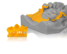
Varseo Wax CAD/Cast