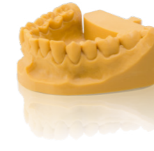
Varseo Wax Model